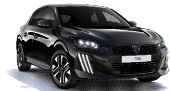
Negro Perla Nera